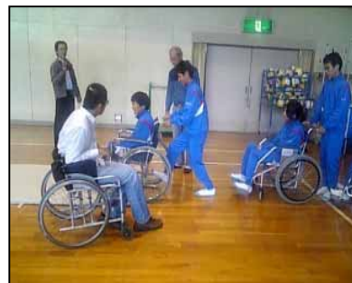
中学校での車いす体験

(2) 「防災」に重点をおいたボランティアの育成、災害弱者に対する地域への意識啓発・防災知識の普及に取り組みました。【実施項目 No.4】