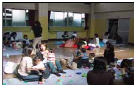
にしっこひろば“もこもこ”(西児童館)