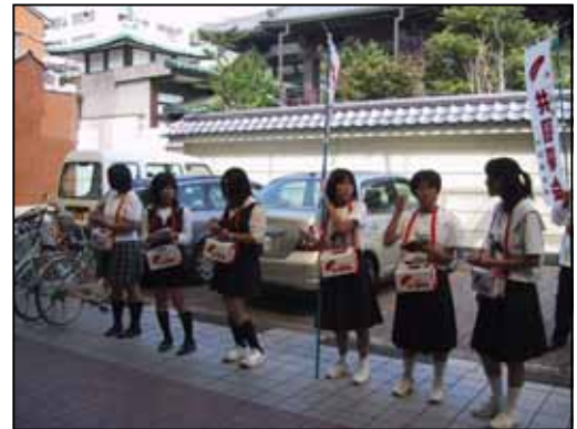
赤い羽根共同募金 街頭募金(円頓寺商店街)