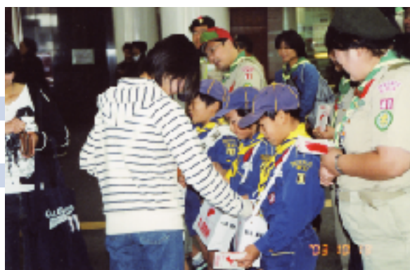
街頭募金(名古屋駅)のようす▶

高齢者ふれあい給食サービス、耐震留具取付サービス、寝具クリーニングサービス、など