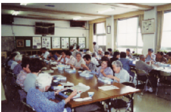
▲高齢者ふれあい給食サービスのようす