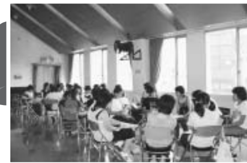
サマーボランティアスクール