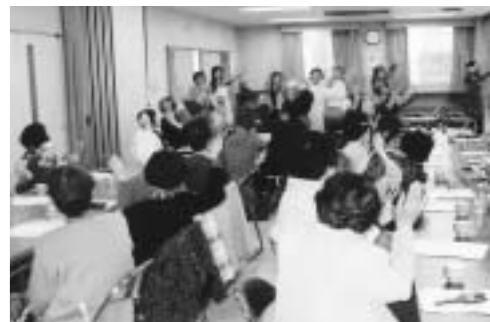
高齢者ふれあい給食サービス