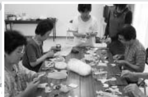
高齢者はつらつ長寿推進事業(いきいきクラブ)