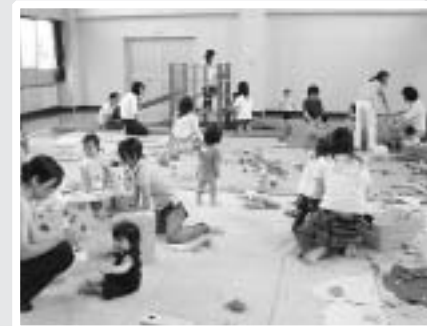
もこもこ(子育てサロン)