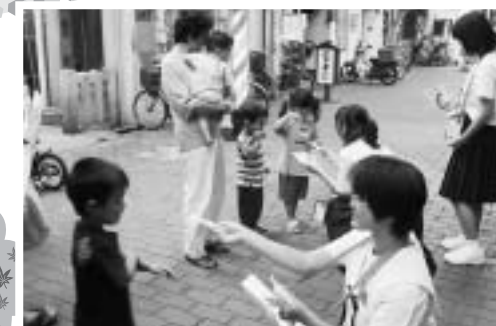
赤い羽根共同募金 街頭募金