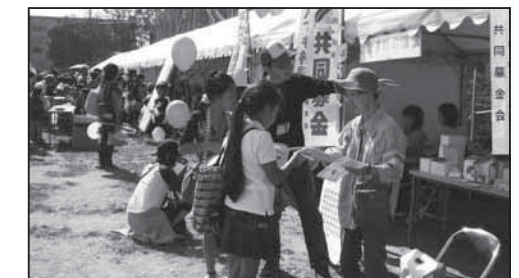
「福祉ふれあい（西区民おまつり広場）」今年も10月10日に行われます。

②三菱東京UFJ銀行 浄心支店 普通預金 1234124 社会福祉法人名古屋市西区社会福祉協議会 会費口 (三菱東京UFJ銀行本支店間に限り振込み手数料無料)