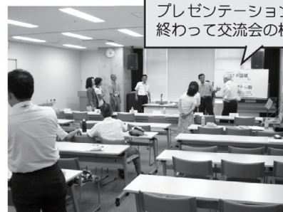
プレゼンテーションが 終わって交流会の様子