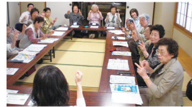
“あと出しジャンケン”で頭の体操中です。