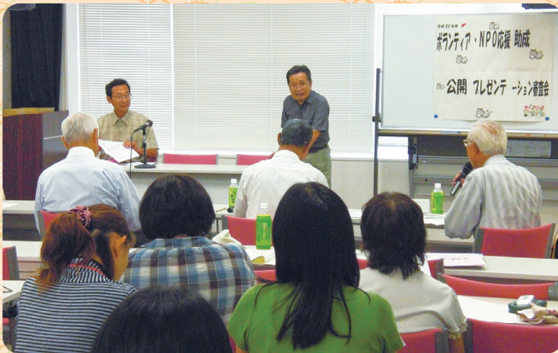
「ボランティア・NPO応援助成公開プレゼンテーション」を開催しました (詳細は2ページをご覧ください)