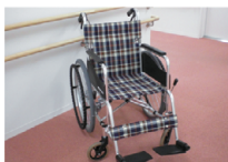
貸し出しや福祉教育で活用させていただきます。