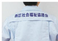
イベントや地域での活動に着用させていただきます。