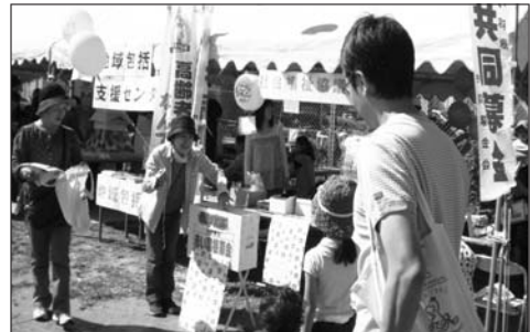
「福祉ふれあい（西区民おまつり広場）」

お申し込み方法 ① 直接本会事務所まで会費をお持ちいただくか、② 下記口座へお振込みください。