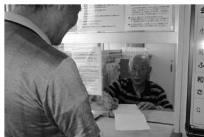
山田コミセンでの相談受付風景

依頼がまだ少ないので、山田学区においても困りごと受付曜日をこれまでの週2日から週6日へ拡大するほか、学区だより等で相談窓口を紹介していきます。