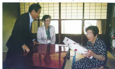
高齢者慰問事業 数え99歳以上の方にお祝品をお届けしています。

お申し込み方法 ①直接本会事務所まで会費をお持ちいただくか、②下記口座へお振込みください。