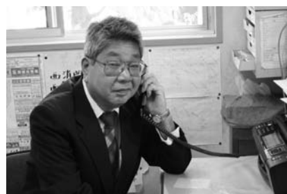
城西コミセンで相談受付中です

身近な地域の相談窓口としての機能を活かして、地域住民同士の助け合い活動を進めていきます。