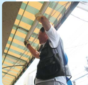
ひとり暮らしで電球の取り替えに困っている方をおたすけ中です。

榎学区の「榎ちょこっとおたすけ隊」では、週2回（月曜日9時～12時、木曜日13時～16時）、榎コミュニティセンターで相談窓口を開設しており、学区在住のひとり暮らし高齢者などからの相談を受け付けています。現在は月2～3件の相談があり、包丁を研いでほしい、電球の取り替えを頼みたい、といった依頼が寄せられ、ボランティアがお手伝いを行っています。