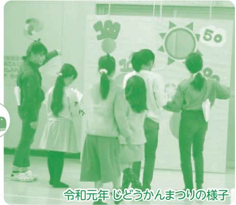
令和元年 じどうかんまつりの様子