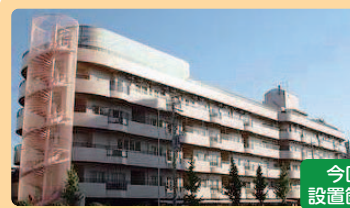
今回設置箇所 なごやかハウス名西様