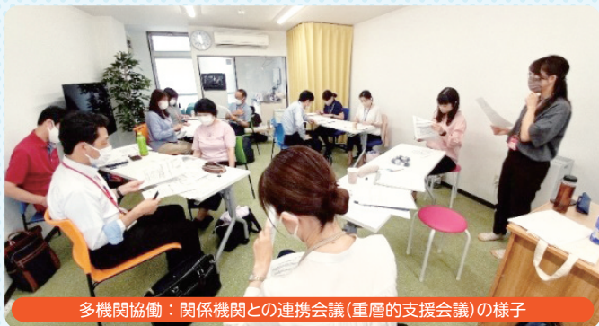
多機関協働：関係機関との連携会議(重層的支援会議)の様子

「ふらっとぷらっと」は、孤立から参加に向けての安心できる居場所として、また地域のつながりづくりの拠点として運営しています。