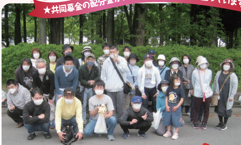
西区手をつなぐ育成会「レッツウオーキング」