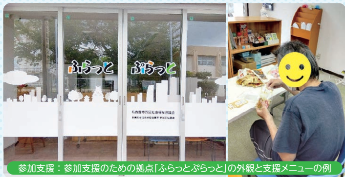
参加支援：参加支援のための拠点「ふらっとぷらっと」の外観と支援メニューの例